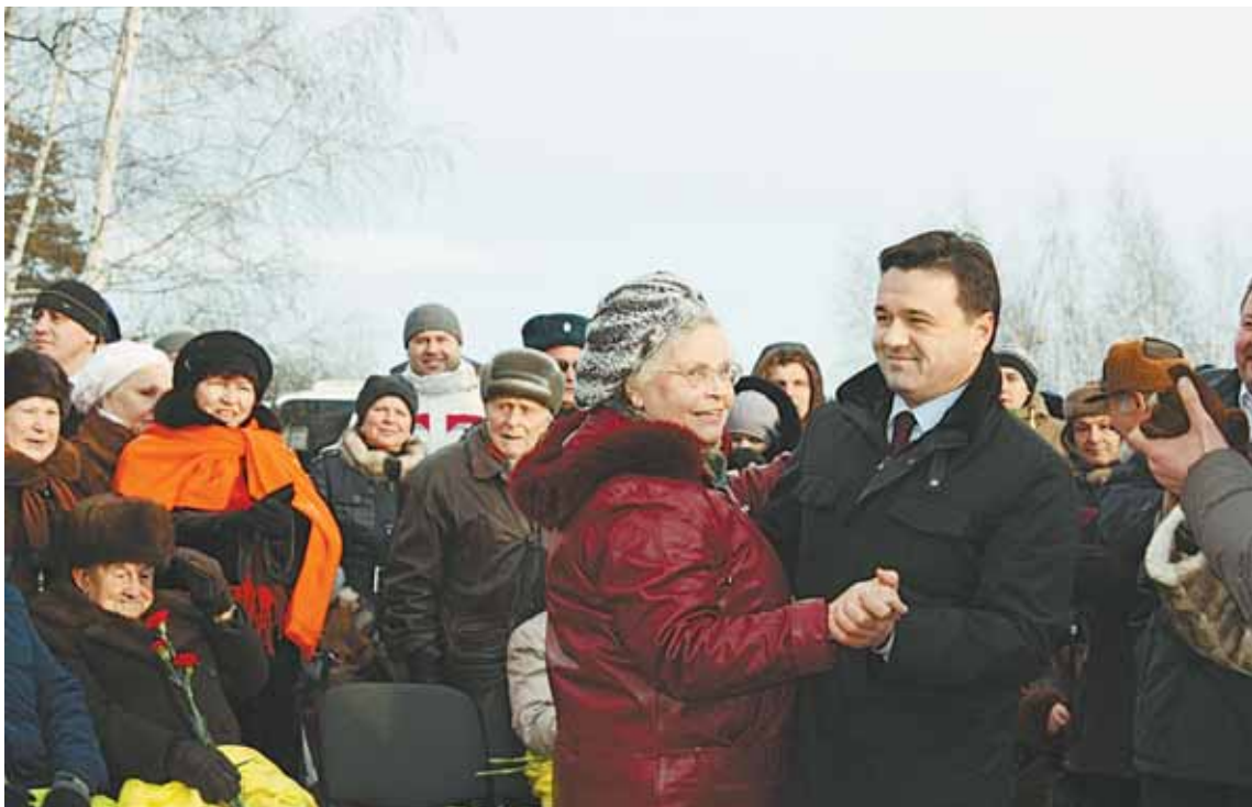
Неформальная обстановка - танец с губернатором Андреем Воробьёвым

– Сегодня Россия впервые отмечает День Неизвестного солдата.