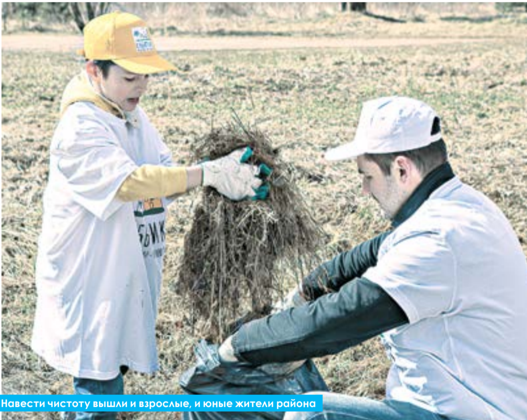
Навести чистоту вышли и взрослые, и юные жители района

На центральной районной площадке – территории около Ново-Иерусалимского монастыря – с утра собралось более 400 человек, а уже к